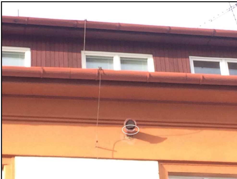
Obr. 1: Ventilační otvor s porušenou mřížkou (elipsa) na východní straně hlavní budovy školy – potenciální stanoviště pěvců